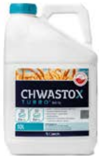
CHWASTOX TURBO 340 SL Qemetica