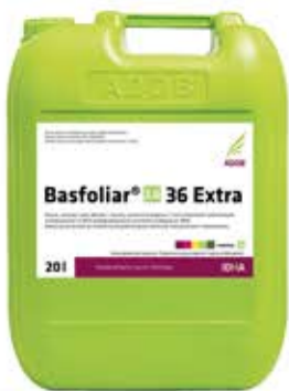
BASFOLIAR 2.0 36 EXTRA Adob