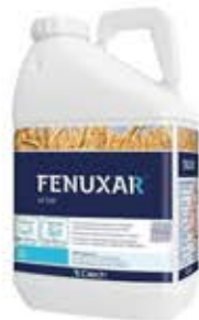
FENUXAR 69 EW Qemetica