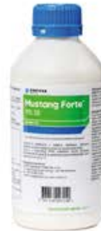
MUSTANG FORTE™ 195 SE Corteva