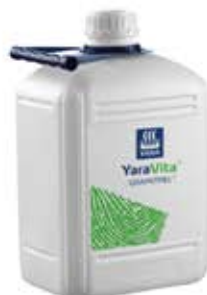
YARA VITA GRAMITREL Yara