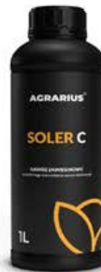
SOLER C Agrarius

*Środki ochrony roślin mogą być nabywane wyłącznie przez osoby pełnoletnie oraz posiadające kwalifikacje wymagane od osób nabywających środki ochrony roślin określone w art. 28. Ustawy z dnia 08.03.2013r. o środkach ochrony roślin (Dz.U.z 2017r. poz.50 z późn.zm.). Nie spełnienie powyższych warunków jest złamaniem regulaminu sklepu. Ze środków ochrony roślin należy korzystać z zachowaniem bezpieczeństwa. Przed każdym użyciem środków ochrony roślin (herbicydów, insektycydów, fungicydów i innych) przeczytaj informacje zamieszczone w etykiecie oprysku i informacje dotyczące stosowania środka ochrony roślin.